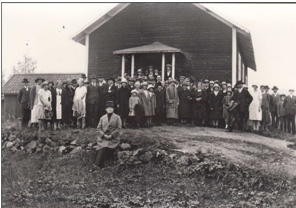
Gruppbild från 1920-talet, sannolikt 1926.