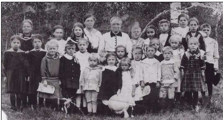
Tre grupper Söndagsskolbarn, cirka 1917. Namnen finns på www.gammelbo.se