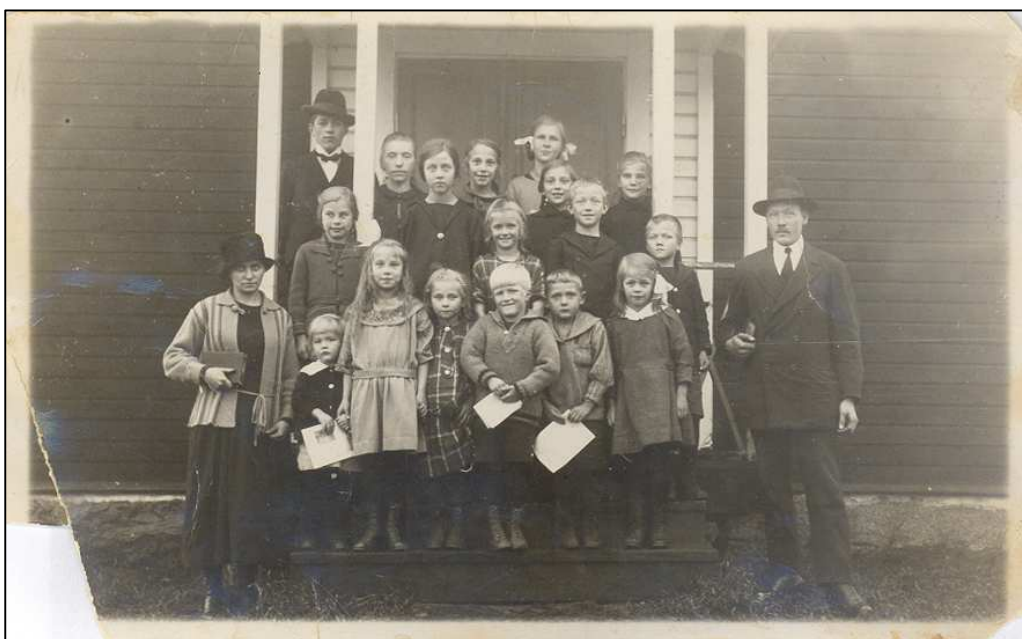
Söndagsskolkort sannolikt från 1926, dvs samtida med församlingens 40-årsfirande.